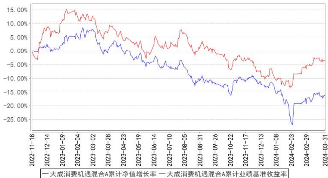
大成消费机遇混合A累计净值增长率与同期业绩比较基准收益率的历史走势对比图