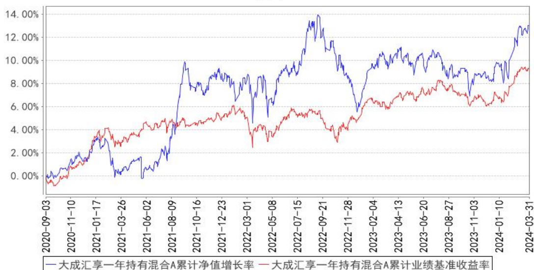
大成汇享一年持有混合A累计净值增长率与同期业绩比较基准收益率的历史走势对比图