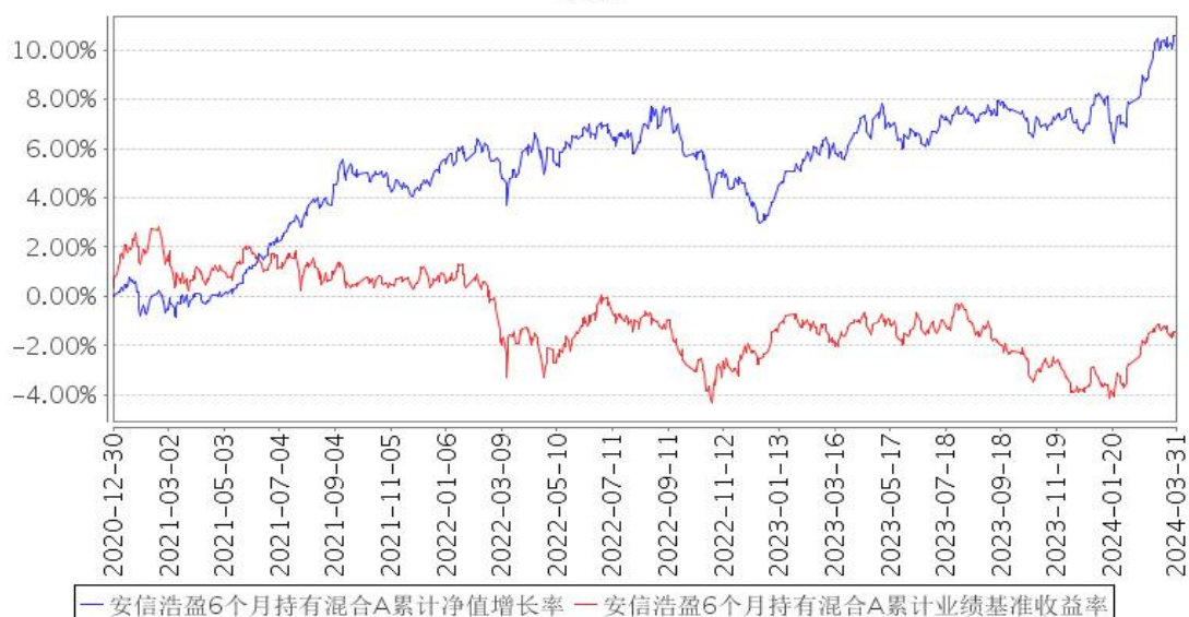
安信浩盈6个月持有混合A累计净值增长率与同期业绩比较基准收益率的历史走势对比图