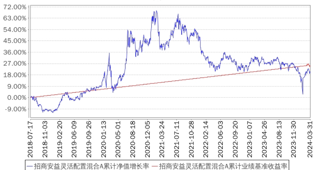
招商安益灵活配置混合A累计净值增长率与同期业绩比较基准收益率的历史走势对比图