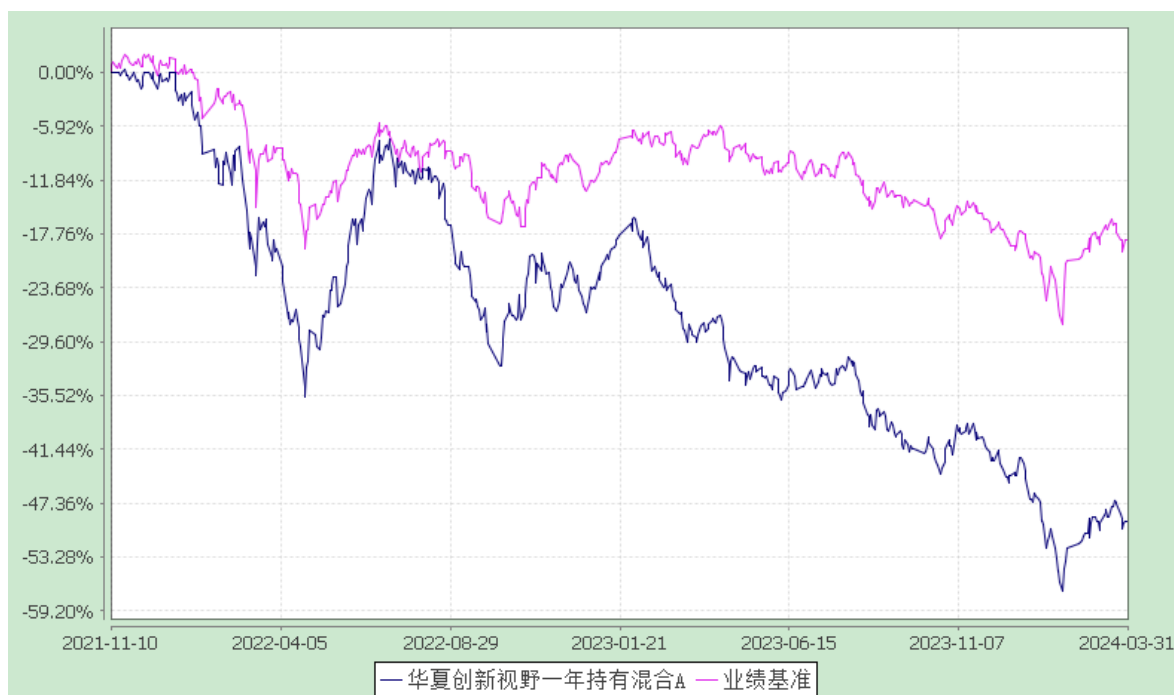
华夏创新视野一年持有混合 C: