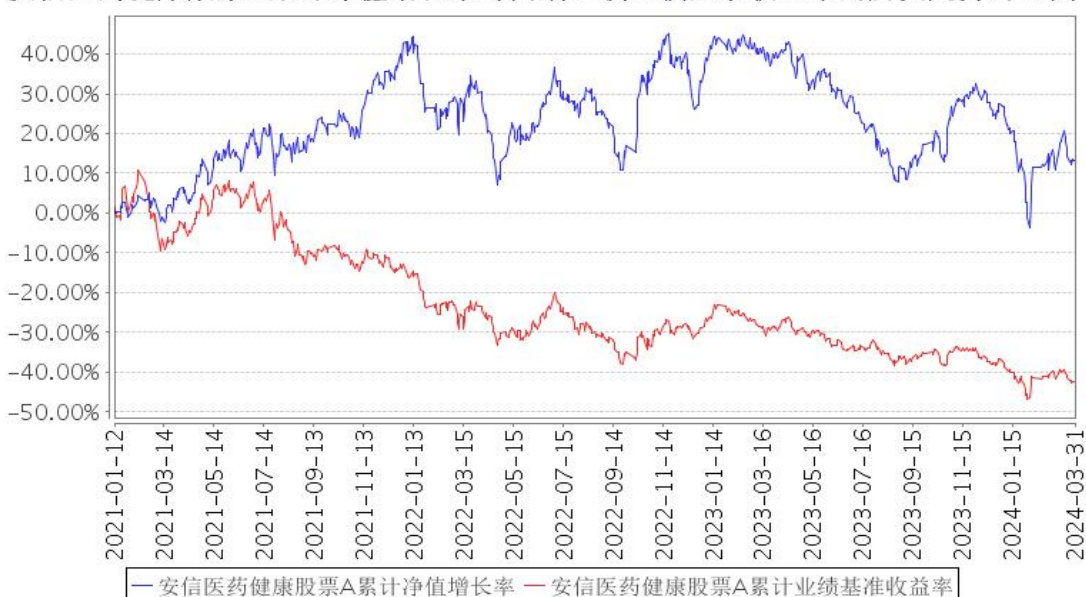
安信医药健康股票A累计净值增长率与同期业绩比较基准收益率的历史走势对比图