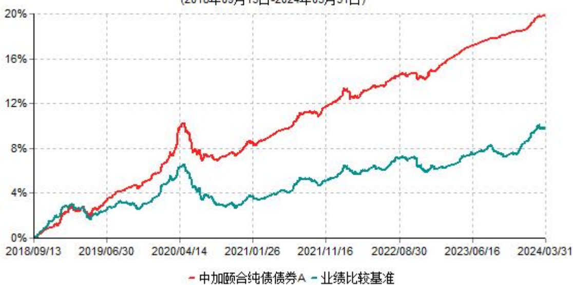
中加颐合纯债债券A累计净值增长率与业绩比较基准收益率历史走势对比图 (2018年09月13日-2024年03月31日)