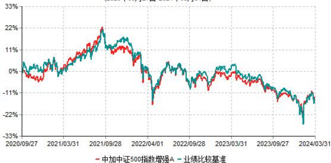
中加中证500指数增强A累计净值增长率与业绩比较基准收益率历史走势对比图 (2020年09月27日-2024年03月31日)