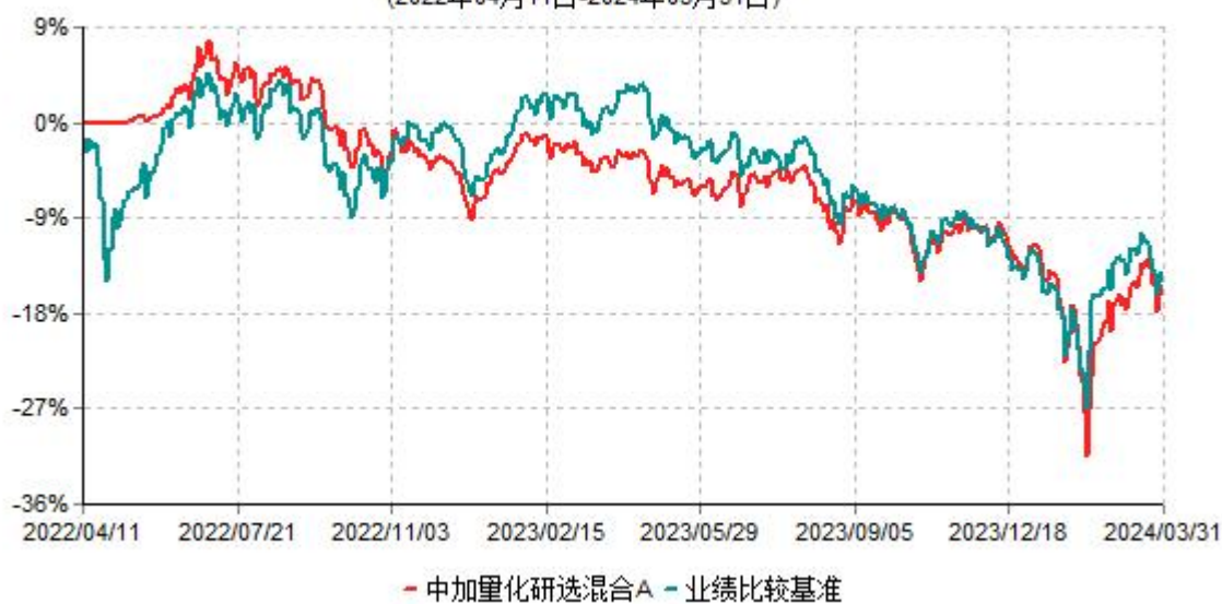
中加量化研选混合A累计净值增长率与业绩比较基准收益率历史走势对比图 (2022年04月11日-2024年03月31日)