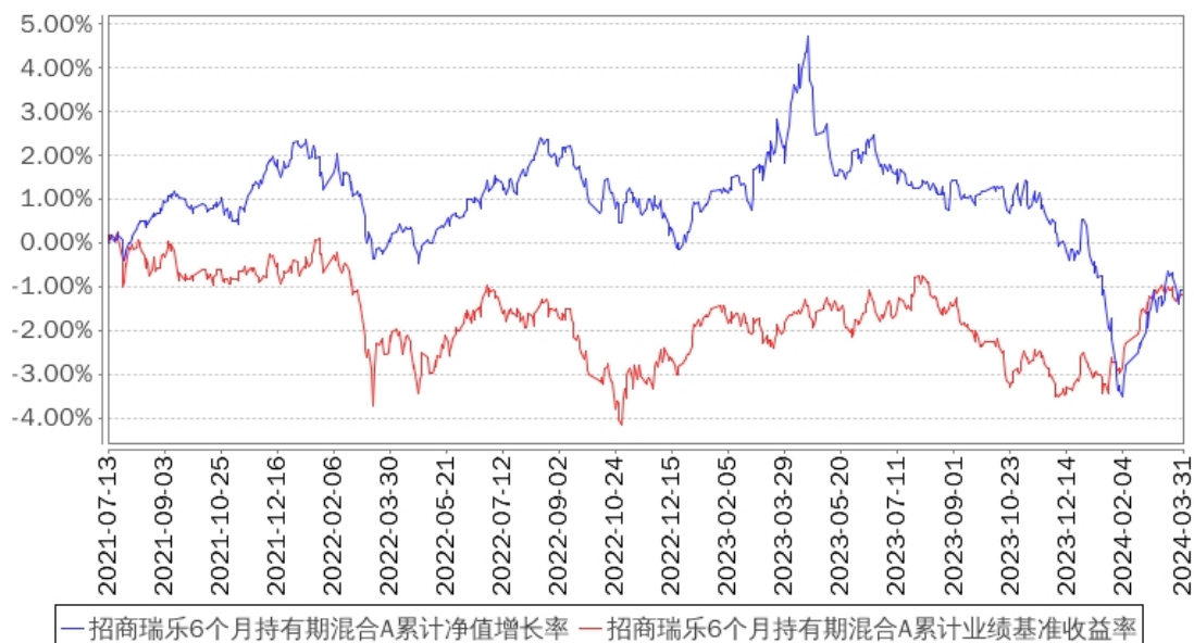
招商瑞乐6个月持有期混合A累计净值增长率与同期业绩比较基准收益率的历史走势对比图