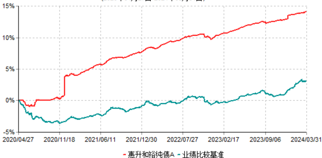
惠升和裕纯债A累计净值增长率与业绩比较基准收益率历史走势对比图 (2020年04月27日-2024年03月31日)