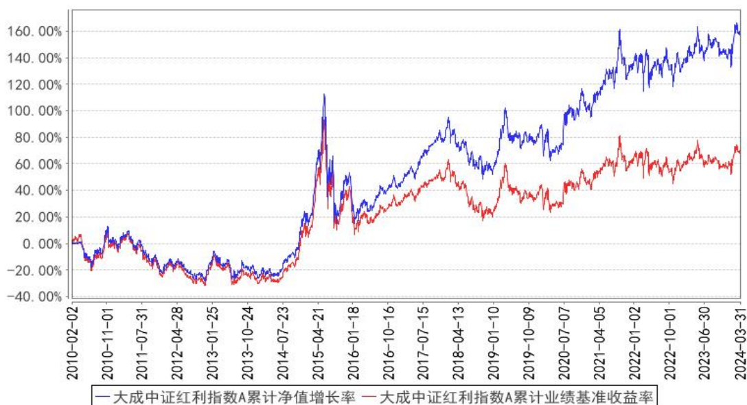
大成中证红利指数A累计净值增长率与同期业绩比较基准收益率的历史走势对比图