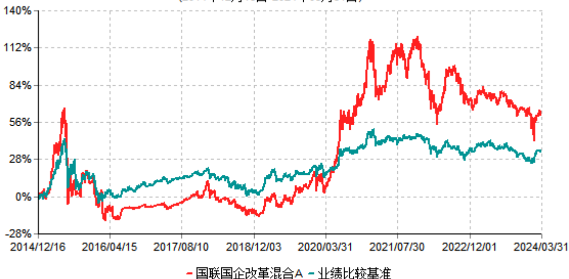
国联国企改革混合A累计净值增长率与业绩比较基准收益率历史走势对比图 (2014年12月16日-2024年03月31日)