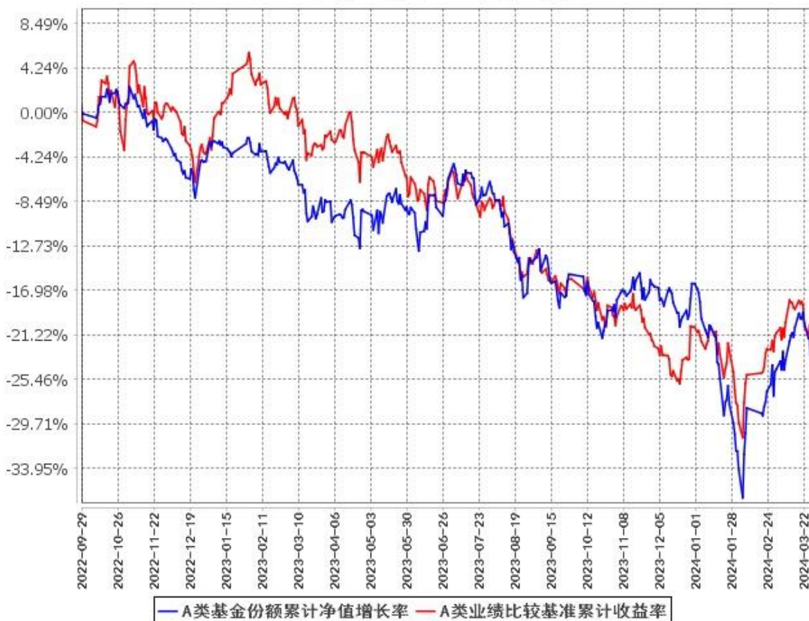
A类基金份额累计净值增长率与同期业绩比较基准收益率的历史走势对比图 (2022年9月29日至2024年3月31日)