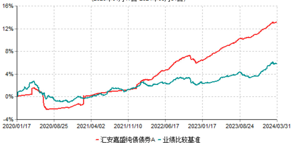
汇安嘉盛纯债债券A累计净值增长率与业绩比较基准收益率历史走势对比图 (2020年01月17日-2024年03月31日)