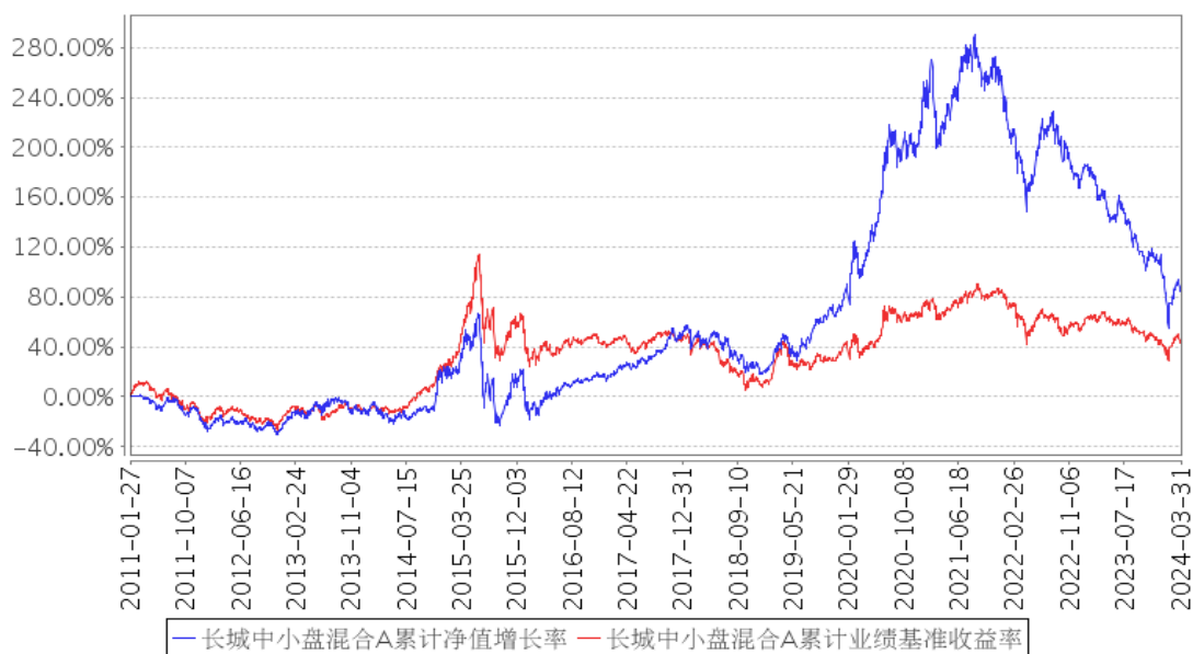
长城中小盘混合A累计净值增长率与同期业绩比较基准收益率的历史走势对比图