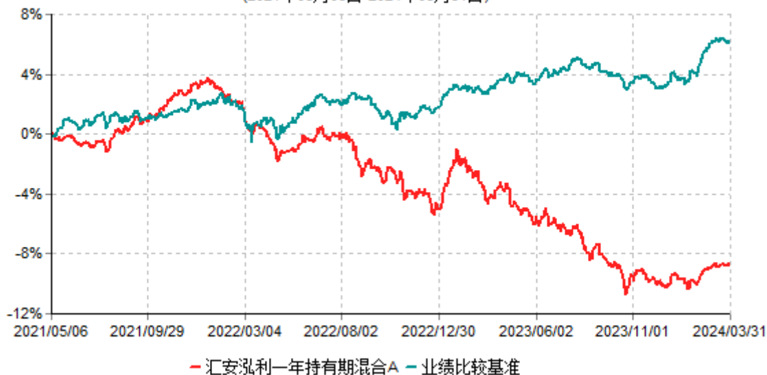
汇安泓利一年持有期混合A累计净值增长率与业绩比较基准收益率历史走势对比图 (2021年05月06日-2024年03月31日)