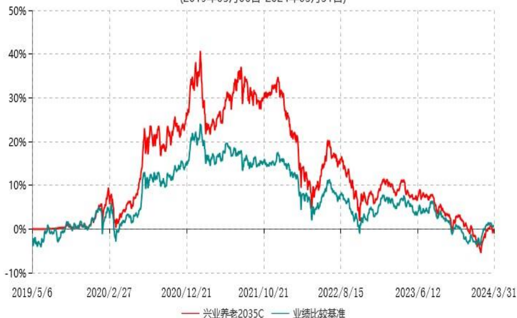
兴业养老2035Y累计净值增长率与业绩比较基准收益率历史走势对比图