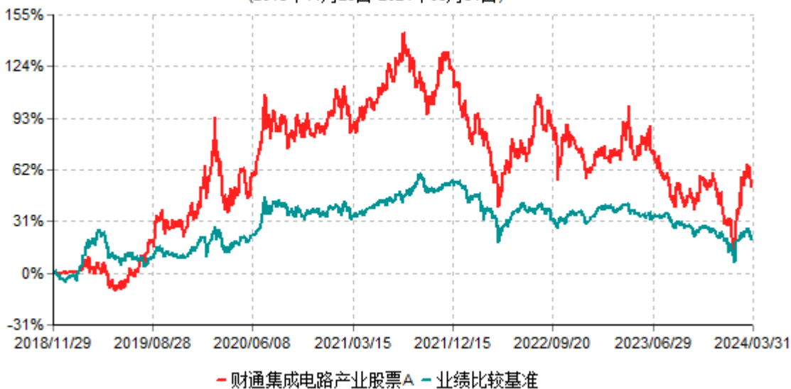
财通集成电路产业股票A累计净值增长率与业绩比较基准收益率历史走势对比图 (2018年11月29日-2024年03月31日)