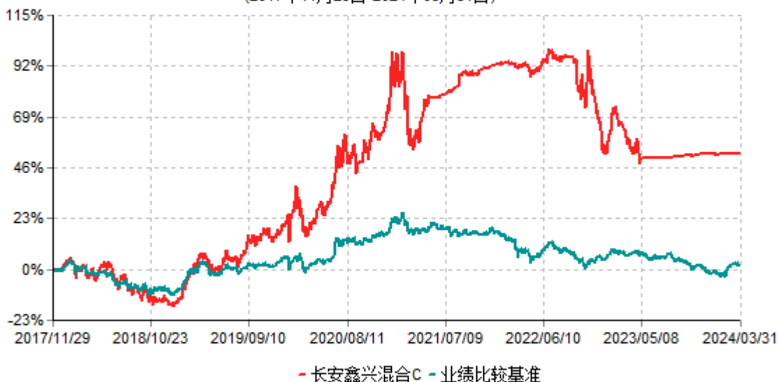
长安鑫兴混合C累计净值增长率与业绩比较基准收益率历史走势对比图 (2017年11月29日-2024年03月31日)

根据基金合同的规定,自基金合同生效之日起6个月内基金各项资产配置比例需符合基金合同要求。截止到建仓期结束时,本基金的各项投资组合比例已符合基金合同的相关规定。基金合同生效日至报告期期末,本基金运作时间已满一年。图示日期为2017年11月29日至2024年03月31日。