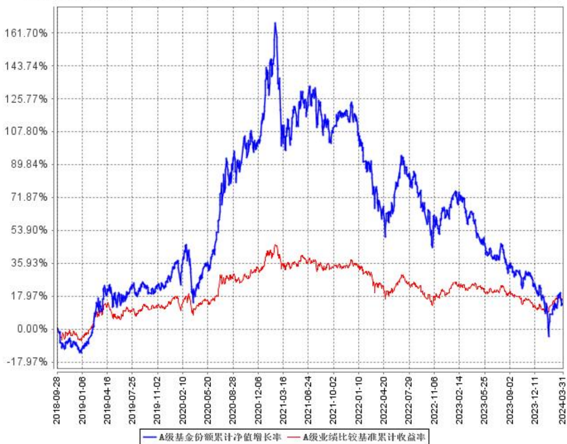
A 级基金份额累计净值增长率与同期业绩比较基准收益率的历史走势对比图