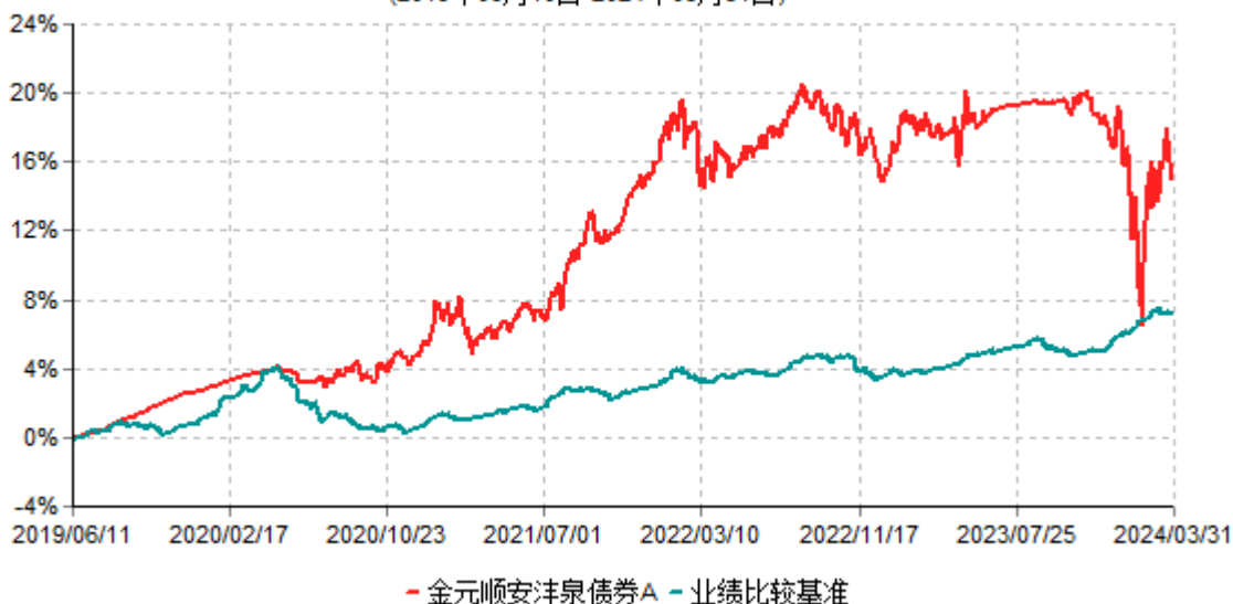
金元顺安沅泉债券A累计净值增长率与业绩比较基准收益率历史走势对比图 (2019年06月10日-2024年03月31日)