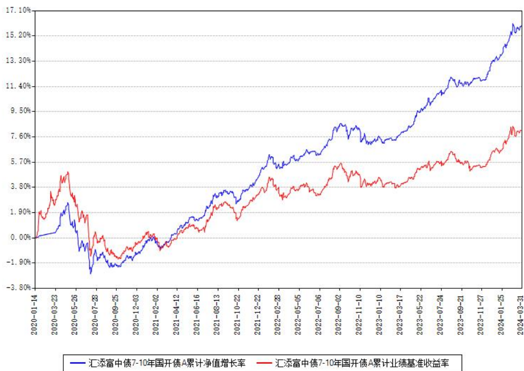
汇添富中债7-10年国开债A累计净值增长率与同期业绩基准收益率对比图