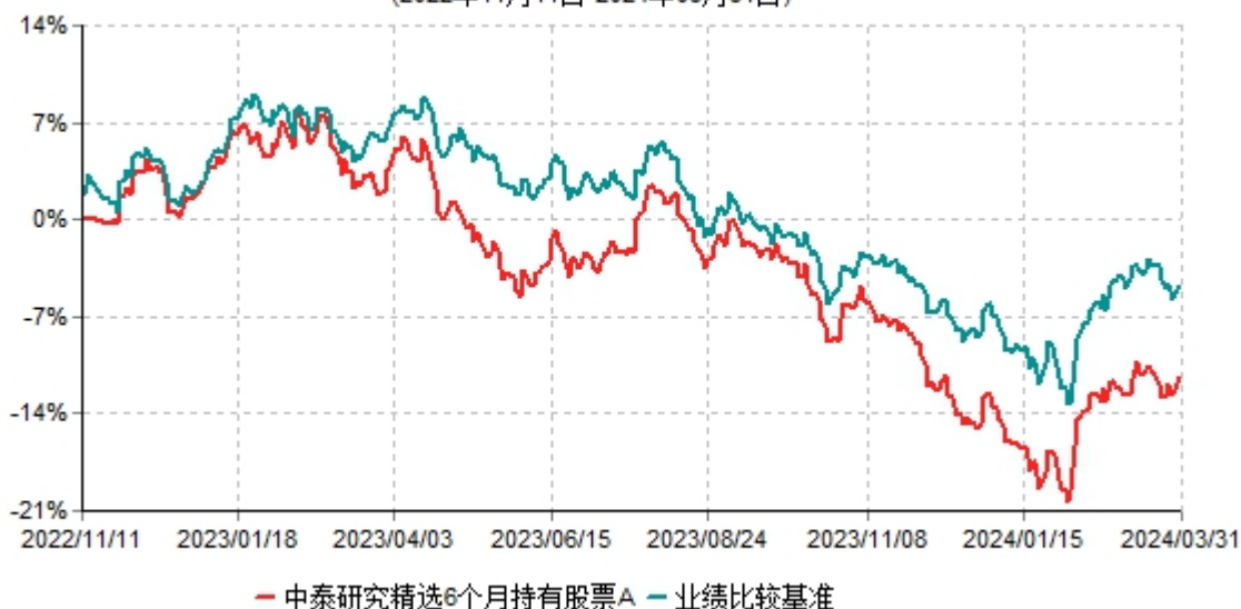
中泰研究精选6个月持有股票A累计净值增长率与业绩比较基准收益率历史走势对比图 (2022年11月11日-2024年03月31日)

注：根据基金合同约定，本基金自基金合同生效之日起6个月内为建仓期。建仓期结束时，本基金各项资产配置比例符合基金合同约定。