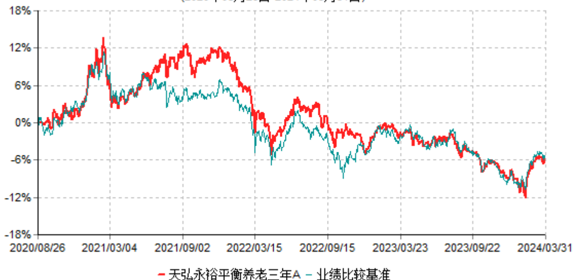
天弘永裕平衡养老三年A累计净值增长率与业绩比较基准收益率历史走势对比图 (2020年08月26日-2024年03月31日)