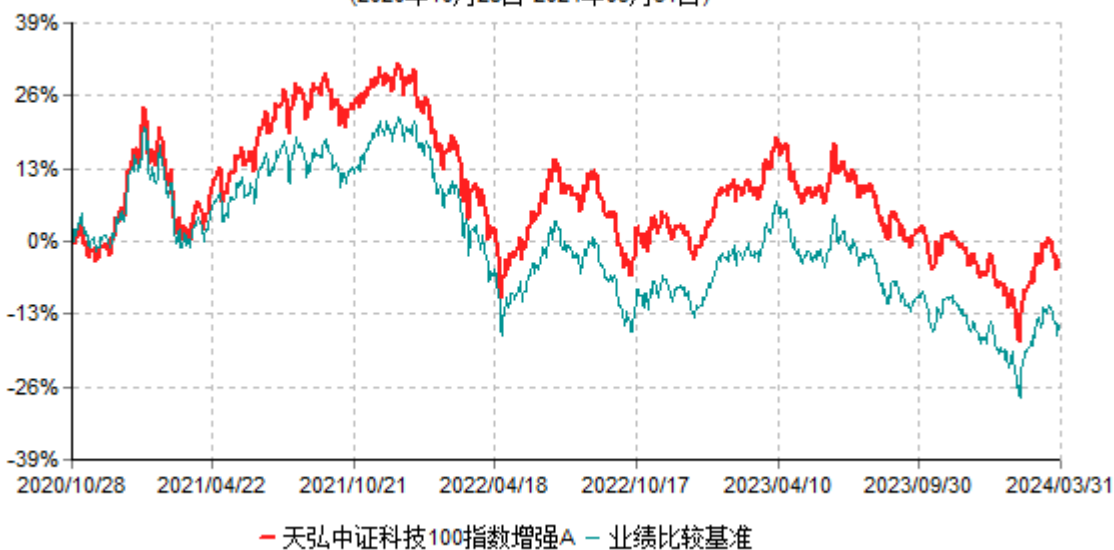
天弘中证科技100指数增强A累计净值增长率与业绩比较基准收益率历史走势对比图 (2020年10月28日-2024年03月31日)