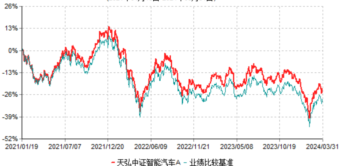
天弘中证智能汽车A累计净值增长率与业绩比较基准收益率历史走势对比图 (2021年01月19日-2024年03月31日)