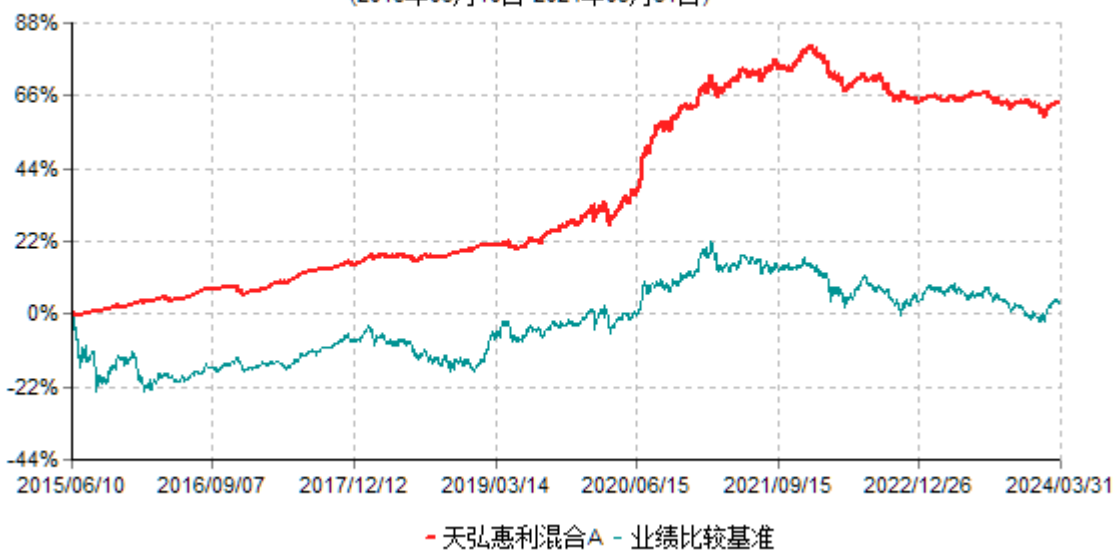
天弘惠利混合A累计净值增长率与业绩比较基准收益率历史走势对比图 (2015年06月10日-2024年03月31日)