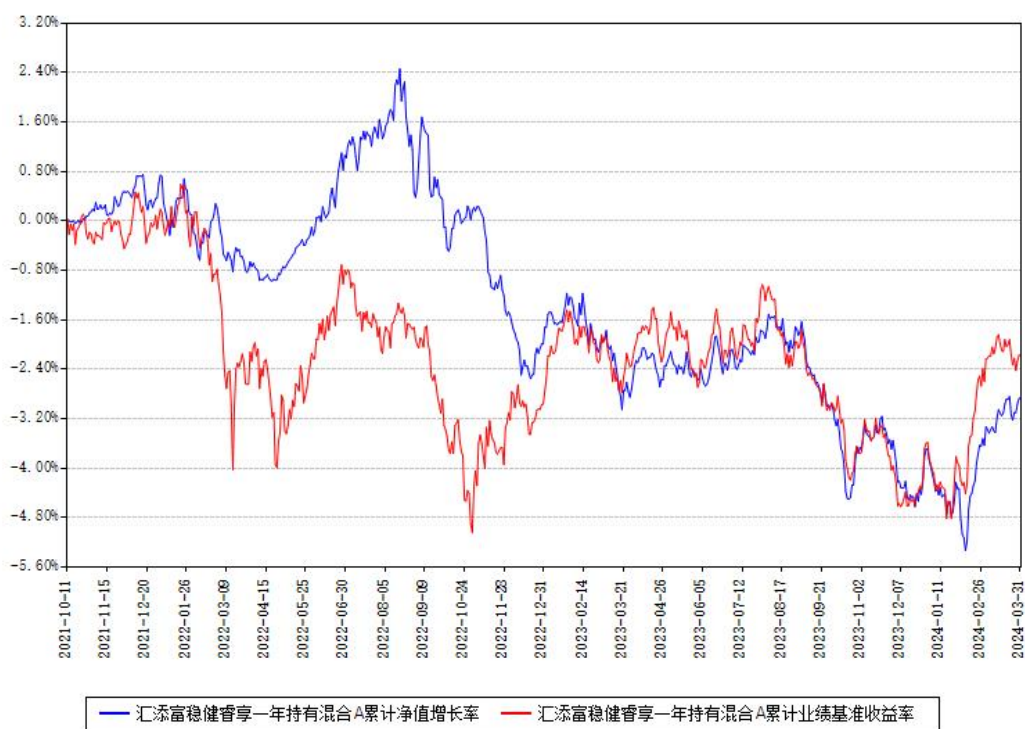
汇添富稳健睿享一年持有混合A累计净值增长率与同期业绩比较基准收益率对比图