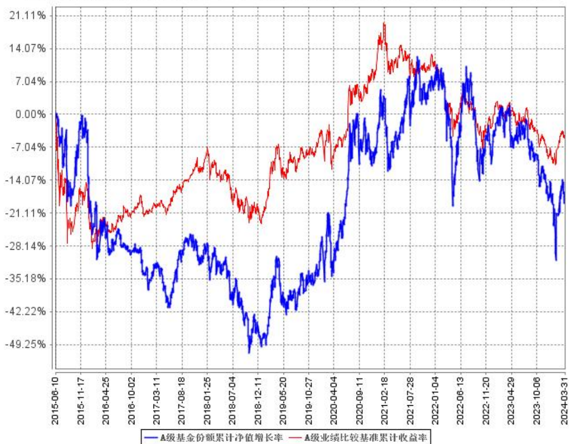
A 级基金份额累计净值增长率与同期业绩比较基准收益率的历史走势对比图