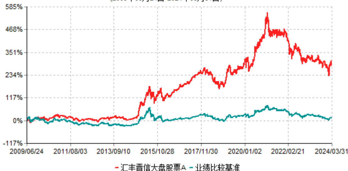
汇丰晋信大盘股票A累计净值增长率与业绩比较基准收益率历史走势对比图 (2009年06月24日-2024年03月31日)