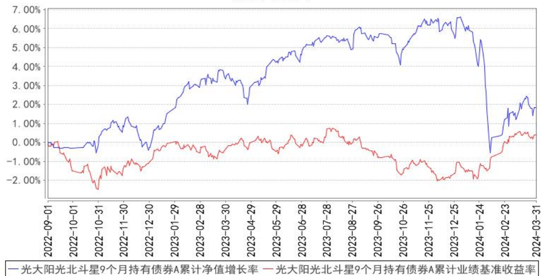
光大阳光北斗星 9 个月持有债券 A 累计净值增长率与同期业绩比较基准收益率的历史走势对比图