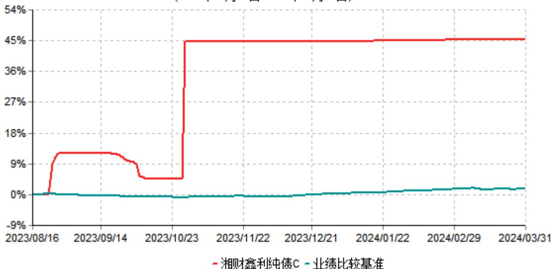
湘财鑫利纯债C累计净值增长率与业绩比较基准收益率历史走势对比图 (2023年08月16日-2024年03月31日)