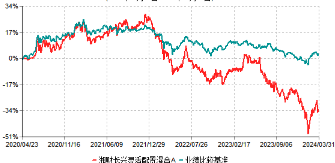
湘财长兴灵活配置混合A累计净值增长率与业绩比较基准收益率历史走势对比图 (2020年04月23日-2024年03月31日)