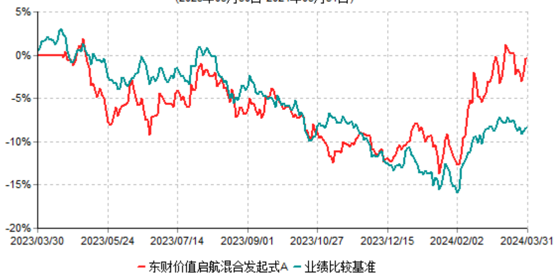
东财价值启航混合发起式A累计净值增长率与业绩比较基准收益率历史走势对比图 (2023年03月30日-2024年03月31日)