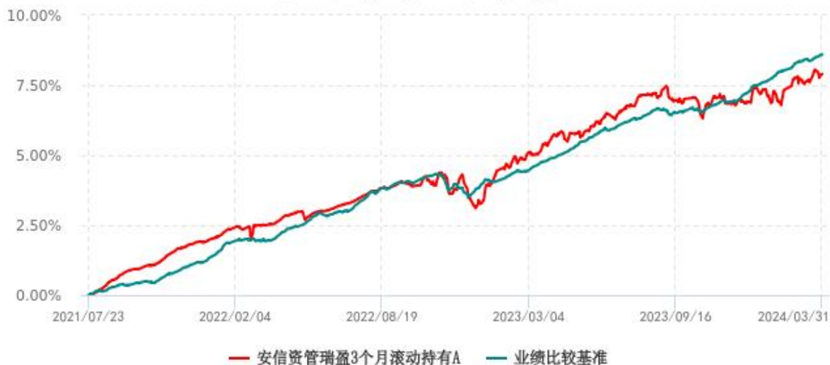
安信资管瑞盈3个月滚动持有A累计净值增长率与业绩比较基准收益率历史走势对比图 (2021年07月23日-2024年03月31日)