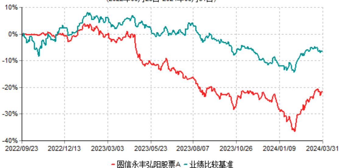
圆信永丰弘阳股票A累计净值增长率与业绩比较基准收益率历史走势对比图 (2022年09月23日-2024年03月31日)