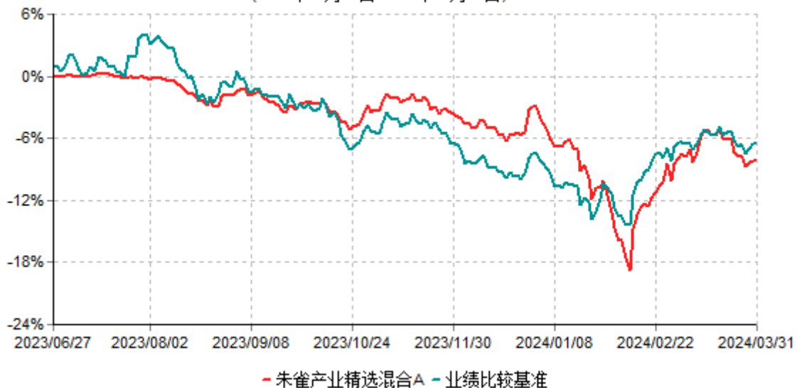
朱雀产业精选混合A累计净值增长率与业绩比较基准收益率历史走势对比图 (2023年06月27日-2024年03月31日)