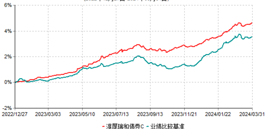
淳厚瑞和债券C累计净值增长率与业绩比较基准收益率历史走势对比图 (2022年12月27日-2024年03月31日)

注：本基金基金合同生效日为 2022 年 12 月 27 日。按基金合同规定，本基金自基金合同生效起 6 个月内为建仓期。建仓期结束时本基金的各项投资比例均符合基金合同约定。