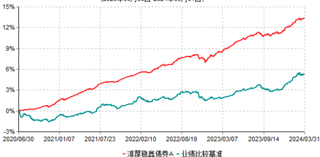
淳厚稳鑫债券A累计净值增长率与业绩比较基准收益率历史走势对比图 (2020年06月30日-2024年03月31日)

注：本基金基金合同生效日为 2020 年 6 月 30 日。按基金合同规定，本基金自基金合同生效起 6 个月内为建仓期。建仓期结束时本基金的各项投资比例均符合基金合同约定。