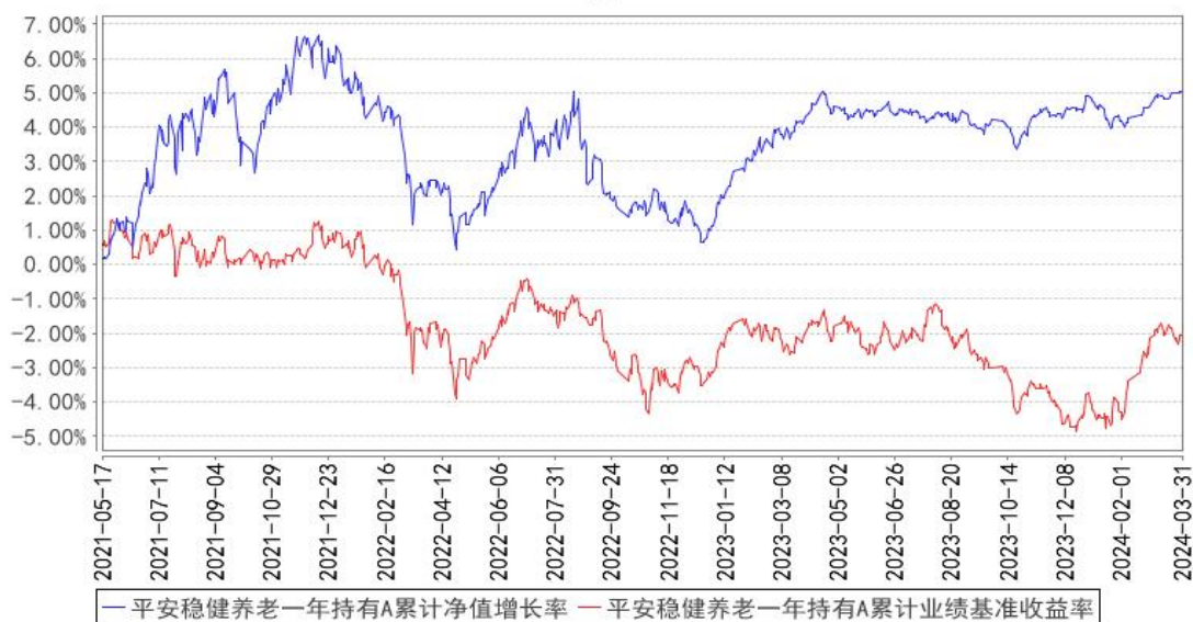
平安稳健养老一年持有A累计净值增长率与同期业绩比较基准收益率的历史走势对比图