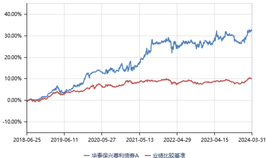
华泰保兴尊利债券 A