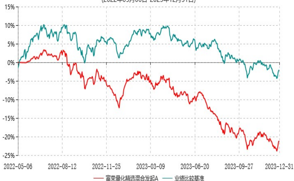
富荣量化精选混合发起C累计净值增长率与业绩比较基准收益率历史走势对比图