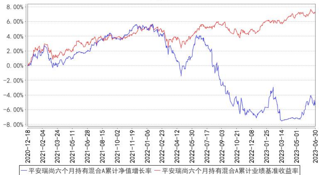
平安瑞尚六个月持有混合A累计净值增长率与同期业绩比较基准收益率的历史走势对比图