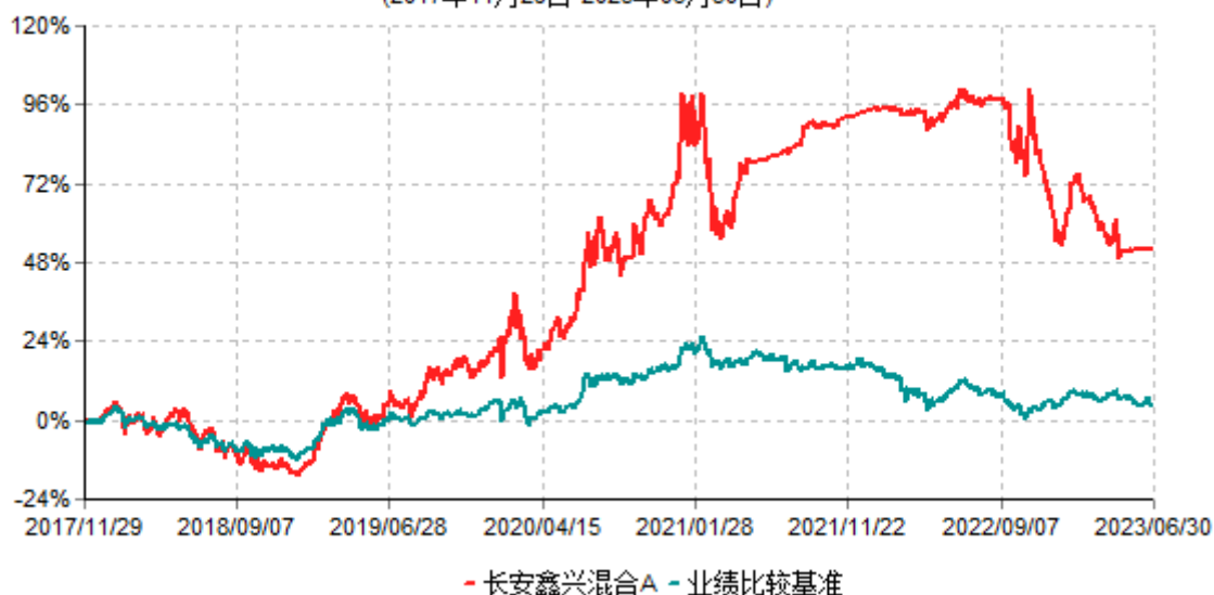
长安鑫兴混合A累计净值增长率与业绩比较基准收益率历史走势对比图 (2017年11月29日-2023年06月30日)

根据基金合同的规定,自基金合同生效之日起6个月内基金各项资产配置比例需符合基金合同要求。截止到建仓期结束时,本基金的各项投资组合比例已符合基金合同的相关规定。基金合同生效日至报告期期末,本基金运作时间已满一年。图示日期为2017年11月29日至2023年6月30日。