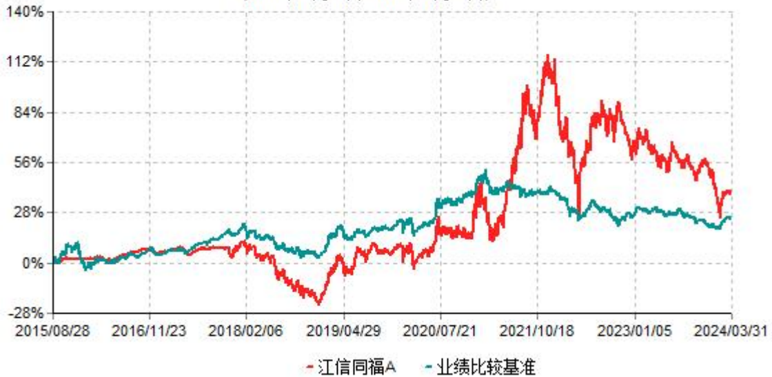
江信同福A累计净值增长率与业绩比较基准收益率历史走势对比图 (2015年08月28日-2024年03月31日)

2、自基金合同生效以来基金累计净值增长率变动及其与同期业绩比较基准收益率变动的比较