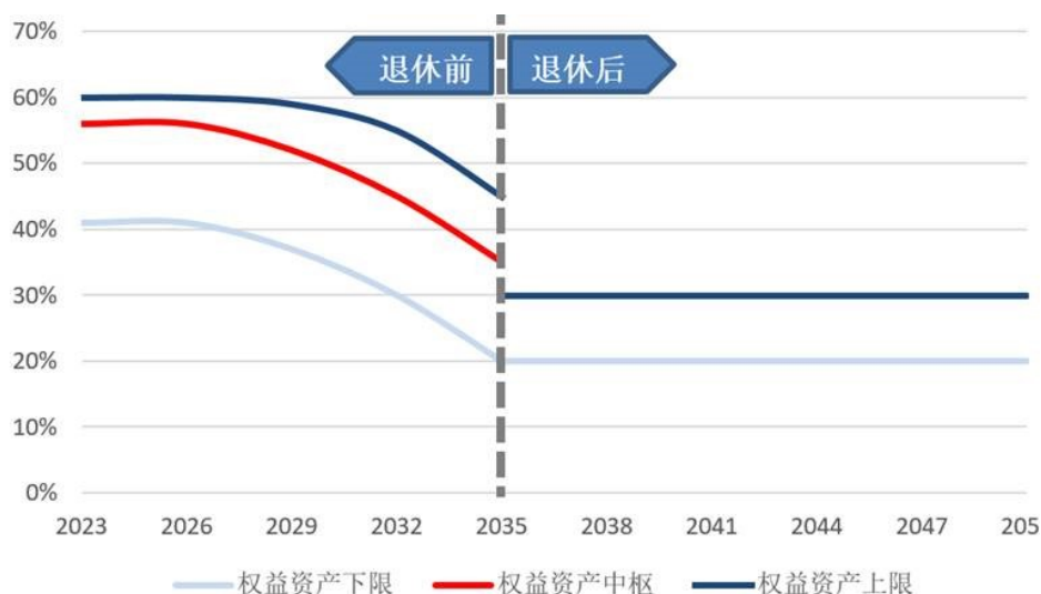
图：本基金下滑曲线

本基金以下滑曲线为依据，设定了权益类资产、非权益类资产的配置目标比例。本基金将在预先设定的下滑曲线的基础上，基于对宏观经济与资本市场环境的审慎分析，结合定量和定性研究，确定最终投资比例，以求达到风险收益的最佳平衡。