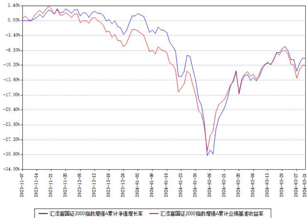
汇添富国证2000指数增强A累计净值增长率与同期业绩基准收益率对比图