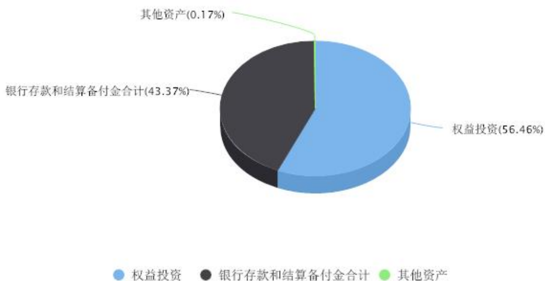
投资组合资产配置图表 数据截止日期:2023年09月30日