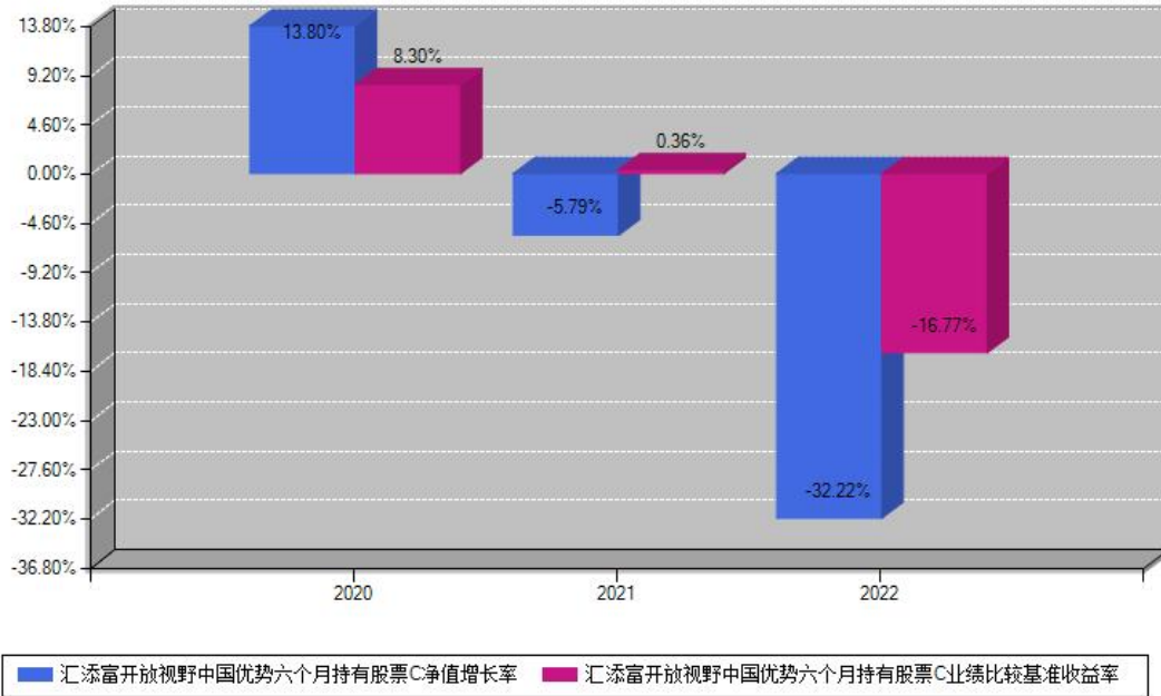
汇添富开放视野中国优势六个月持有股票C每年净值增长率与同期业绩基准收益率对比图

注：数据截止日期为2022年12月31日，基金的过往业绩不代表未来表现。本《基金合同》生效之日为2020年07月22日，合同生效当年按实际存续期计算，不按整个自然年度进行折算。